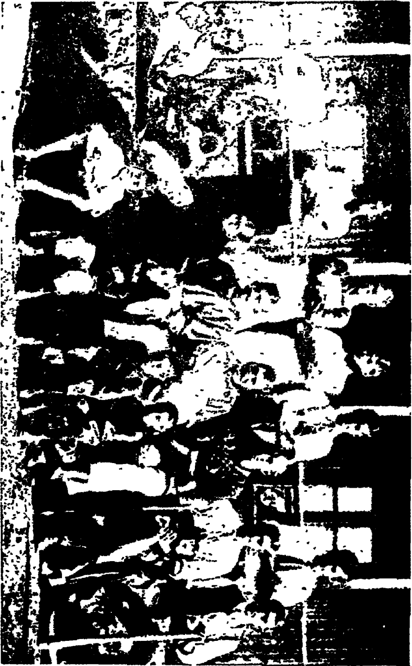
गांधीजी और कलिनबंका : डॉल्स्टॉप-कामं परिवारके साथ (१९१०)